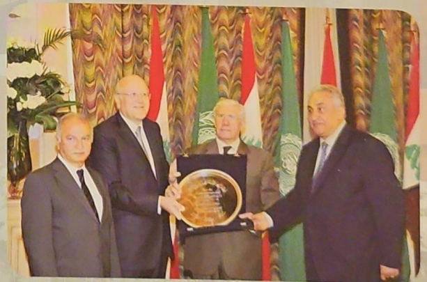
ودولة الرئيس نجيب ميقاتي