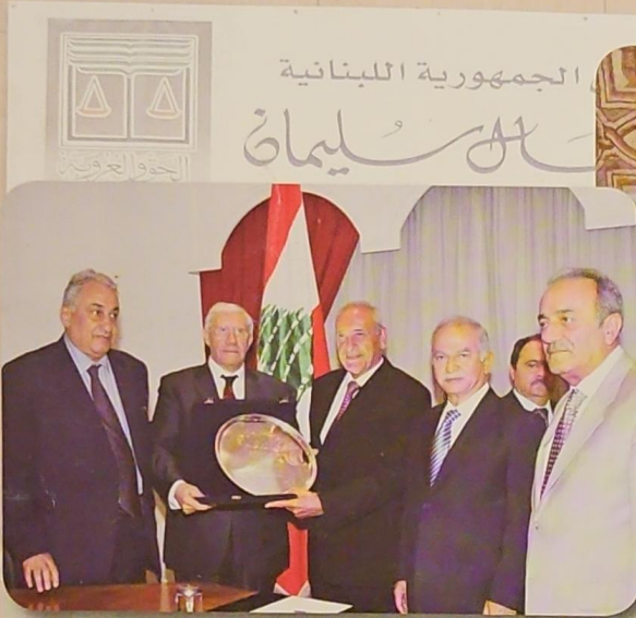
ودولة الرئيس نبيه بري