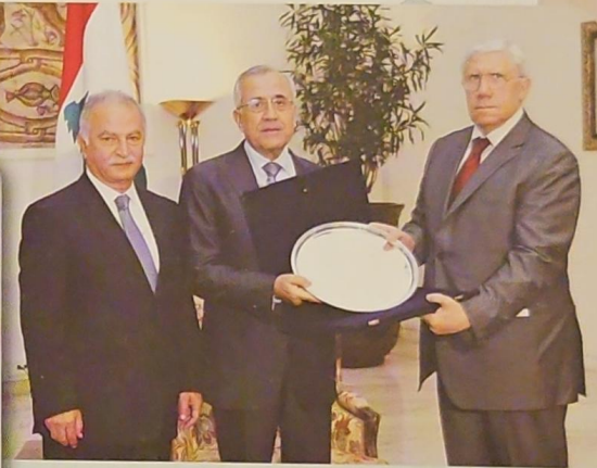
فخامة الرئيس مستلمًا درعًا من اتحاد المحامين العرب